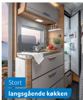
Stort langsgående køkken

550 MF. Med udvidelsen til den franske seng får du endnu mere plads i fodenden.