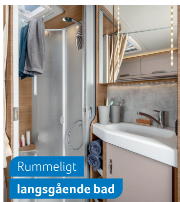
Rummeligt langsgående bad

650 MEG. 2 gasblus og et stort køleskab - perfekte forudsætninger for madlavningen.