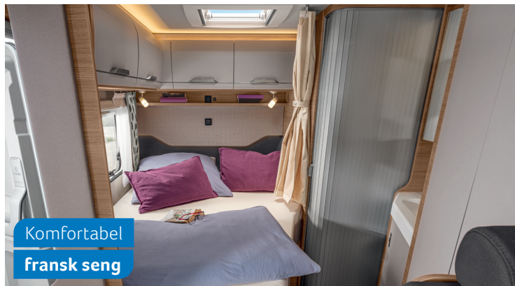
Komfortabel fransk seng

650 MEG. Det smukke VANSATION-broderi og COZY-HOME-pakken er et optisk highlight i din VAN TI.