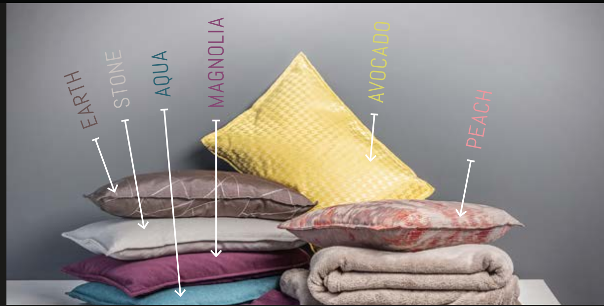
DAS DEKO-PAKET BEINHÄLTET VIER KISSEN, ZWEI KUSCHELDECKEN UND EINE TISCHDECKE. DU KANNST ZWISCHEN 6 FARBEN WÄHLEN. THE "DECO" PACKAGE CONTAINS FOUR CUSHIONS, A SOFT AND CUDDLY BLANKET AND A TABLE CLOTH. YOU CAN SELECT FROM A RANGE OF SIX COLOURS.