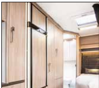
Stort 177 l. køleskab