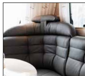
2 stk. nakkestøtter