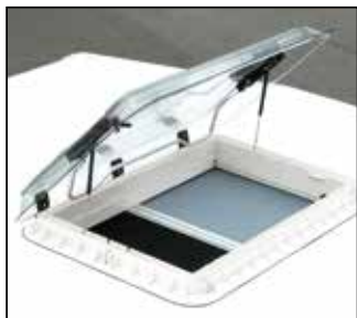
Heki II De Luxe