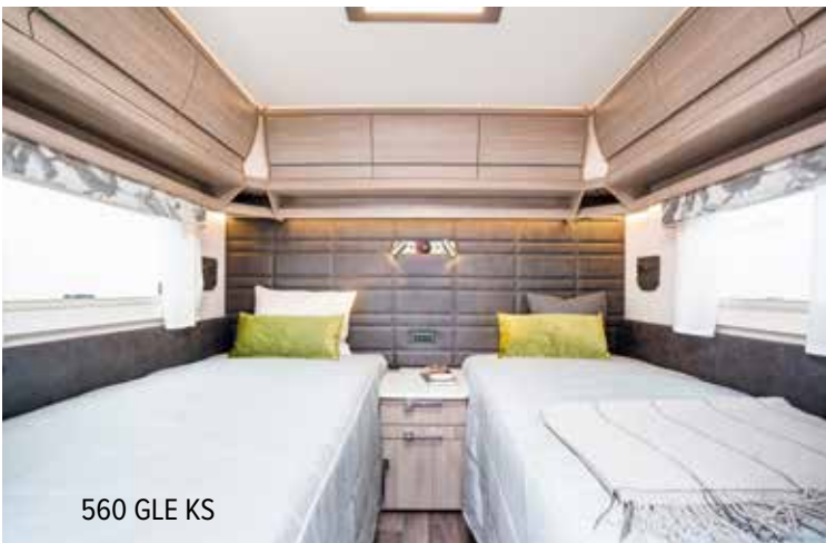
560 GLE KS