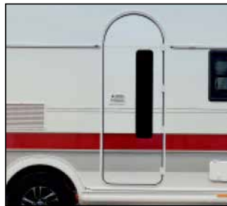
Vindue i dør