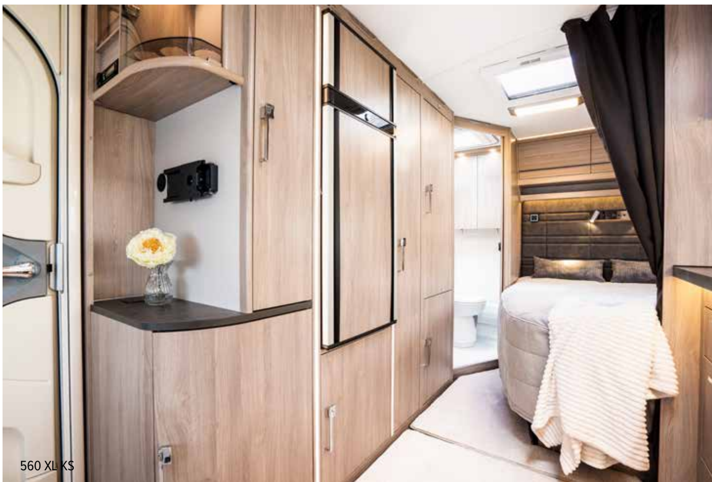
560 XL KS