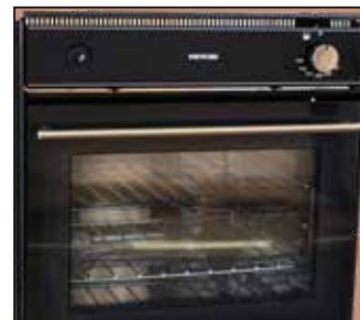
Ovn under køkkenbordet